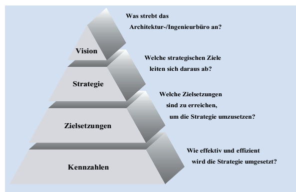
3 Zielhierarchie von Vision, Strategie, Zielen und Kennzahlen

Im nächsten Schritt sind für die ausgewählte Strategie konkrete kurz- und mittelfristige Zielsetzungen für das Gesamtunternehmen festzulegen und anschließend schrittweise auf die nachfolgenden Bereiche bzw. Abteilungen, Projektgruppen und Mitarbeiter herunterzubrechen. Als Hilfsmittel zur Umsetzung der ausgewählten Strategie in kurz- und mittelfristige Zielsetzungen hat sich die Balanced Scorecard (BSC) bewährt. Die BSC hat die Funktion, den gesamten Planungs-, Steuerungs- und Kontrollprozess zu gestalten, und ist ein wesentlicher Bestandteil des Managementinformations- und Managementreportingsystems. Sie verbindet die strategische Unternehmensplanung durch klare Zielsetzungen, Kennzahlen, Zielwerte und Maßnahmen mit dem Unternehmens- und Projektcontrolling. Schließlich kommt man zum kritischen Teil: der Strategieumsetzung. Dabei fällt der disziplinierten und konsequenten Umsetzung der Zielsetzungen eine besondere Bedeutung zu, denn 75% der Strategien scheitern nicht am Konzept,